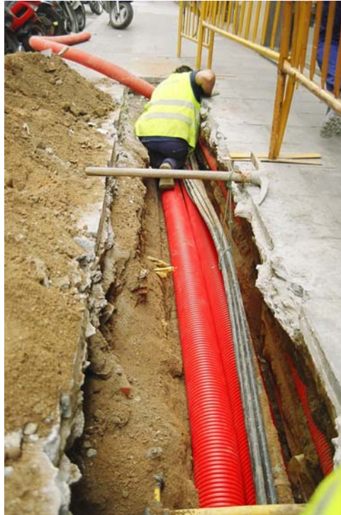
Fotografia núm. 7.

Rasa 100 davant de la finca núm. 27-29 del c/ Nou, mirant al nord-est, amb la canalització preparada.