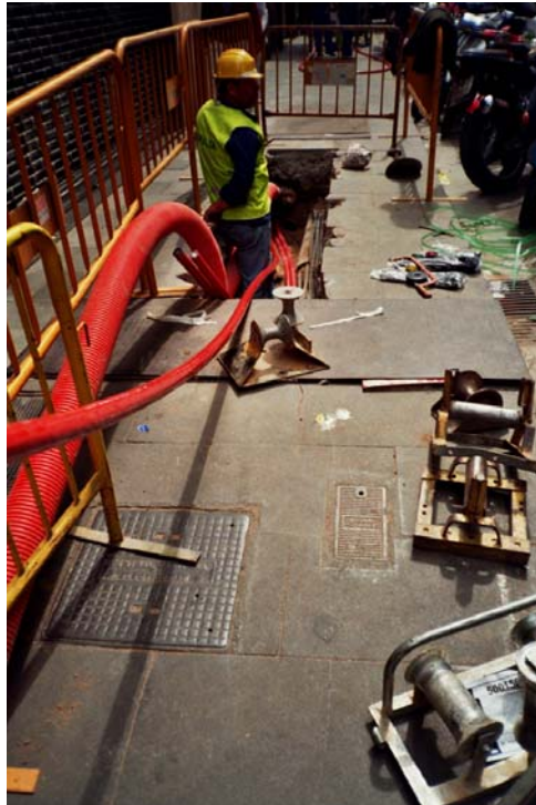
Fotografia núm. 8.

Rasa 100 davant de la finca núm. 27-29 del c/ Nou, mirant al nord-est, amb la canalització preparada.